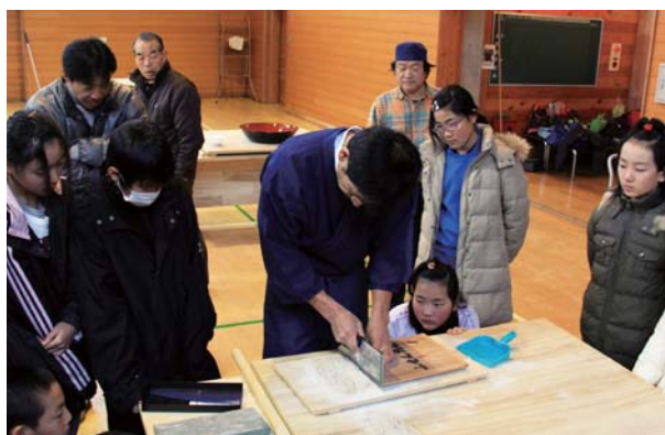
指導員の手さばきを真剣に観察する児童たち