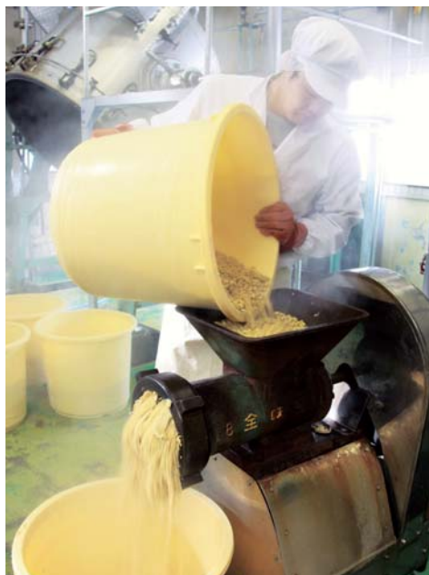
昔ながらの製法で作る「黒部名水糀みそ」

名水糀みそには、黒部の名水のほか、市内で栽培された大豆と黒部米コシヒカリを使用し、昭和初期から変わらぬ製法で作っています。できたてをその場で袋に詰め、即日発送。無添加で糀が生きているこのみそ