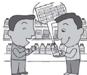
購入の小売店またはJAへ持ち込む