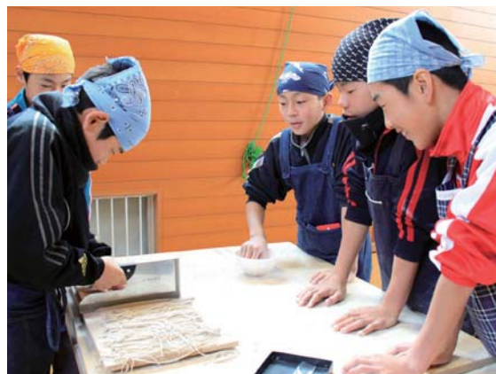
たとってもご愛嬌！おいしいそばができました

「黒部名水そば打ち研究会」の指導員からアドバイスを受けながらそば打ちに挑戦。打ちたてのそばは、その場で茹でられ、地元特産の香り豊かなそばを堪能しました。