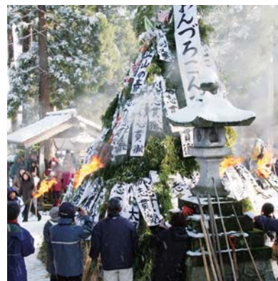
1年の健康と豊作を祈って点火

一月十四日、下立神社で江戸時代から続く左義長「おんづろこんづろ」が行われ、地元住民が無病息災や五穀豊穡を願いました。書初めが燃え上がる様子が、大鶴と子鶴が飛ぶように見えること