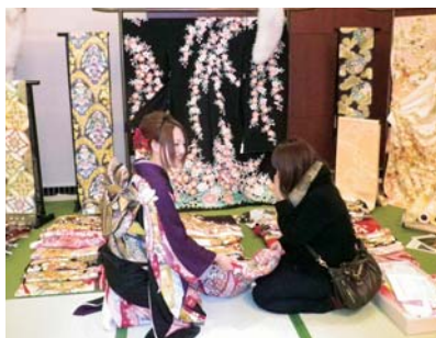
華やかな振袖にうっとり

一月二十七日(三十日、ホテルグランミラーージュで第二十九回くみあいきもの大祭典を開催しました。今回は、着なくなった着物をリメイクして洋服や小物として新たに使えるようにするという企画や平安時代からの伝統ある「墨流し染め」の実演がされ、来場者は和の魅力に心弾ませました。