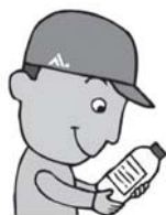
農家で回収対象品の確認