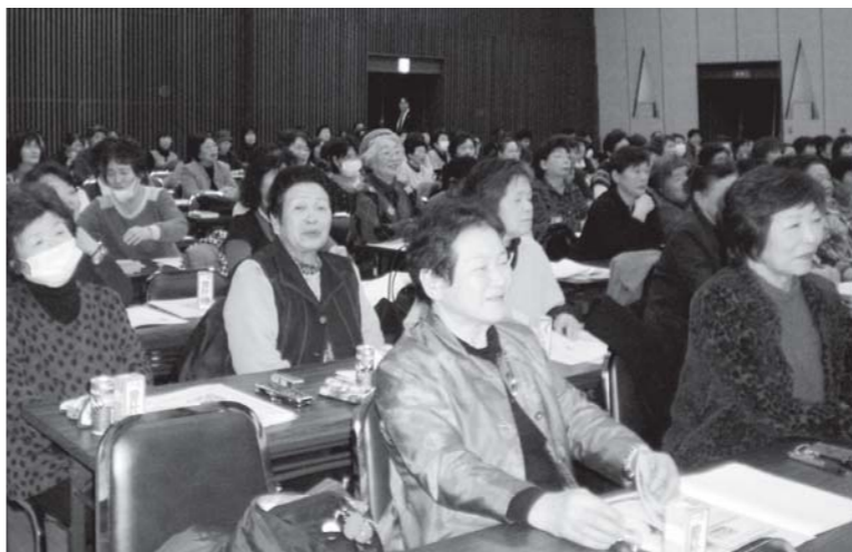
講演に聞き入る参加者

針に糸を通すのが大変だったけど、あったかいアームウオーマーが出来た。早速家で使いたい」「まだ余ってない？もう一つ家でまた作りたいわ」と、大変喜ばれました。 また、この材料代金の一部が東日本大震災の被災地へ義援金として届くことになっています。