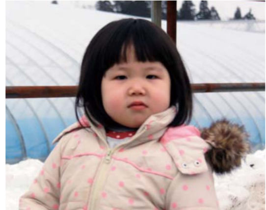
わが家の 愛 アイドル (前沢)