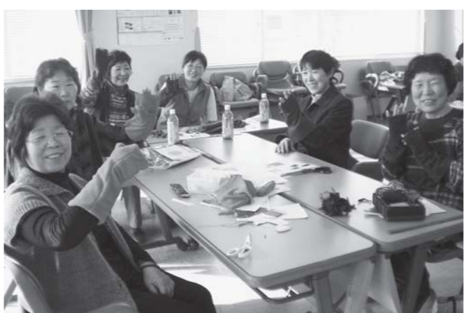
出来上がったアームウオーマーを着ける学級生

また、東日本大震災チャリティバザーも行われ、参加した女性部員らが家で使わない品物などを持ち寄り、集い終了後に参加者が買い求めました。