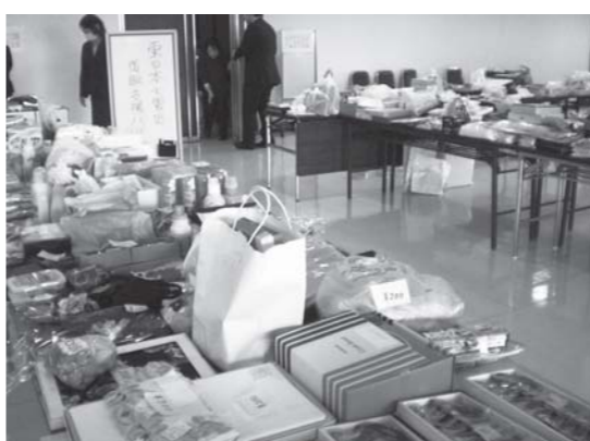
参加者が持ち寄ったチャリティバザーの品々

また、東日本大震災チャリティバザーも行われ、参加した女性部員らが家で使わない品物などを持ち寄り、集い終了後に参加者が買い求めました。