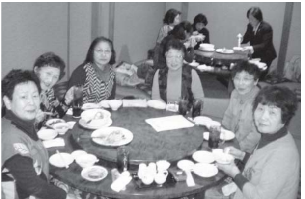
中華のフルコースを堪能した学級生

J A クッキング浦山教室は、3月2日に閉級式が行われました。閉級式の後、入善町の中華料理店「黄鶴樓(こうかくろう)」で会食を行いました。 店員の説明を受けながら、前菜からメインディッシュ、デザートまで10品の料理に舌鼓を打ちました。 学級生たちは「久しぶりに中華料理のフルコースを頂いた。来年もまた参加したい」と話していました。